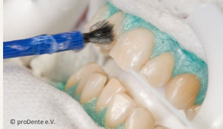
Power-Bleaching beim Zahnarzt: Auftragen des Bleaching-Gels

Wenn Sie die Praxis wieder verlassen, können Sie sich an sichtbar helleren Zähnen freuen!