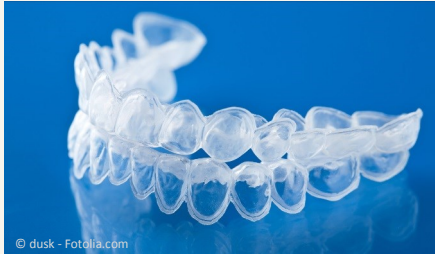
Bleaching-Form aus Kunststoff, in die Sie das Aufhellungs-Gel einfüllen.

Beim Home-Bleaching werden vom Zahnarzt dünne flexible Formen aus einem transparenten Kunststoff hergestellt, die genau auf Ihre Zähne passen (siehe Foto).