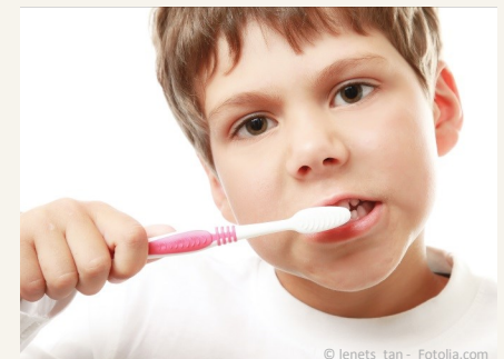
Bei der Prophylaxe lernen Ihre Kinder die richtige Zahnpflege.

Es gibt also keinen Grund, warum Sie auf Prophylaxe für Ihre Kinder verzichten sollten.